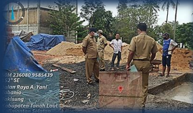
Cek Lapangan Permohonan IMB