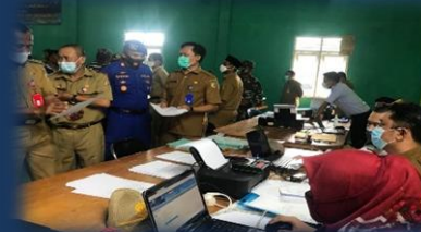
Gerei Pelayanan BPKP