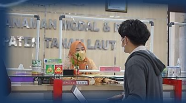
Pelayanan Perizinan Berusaha