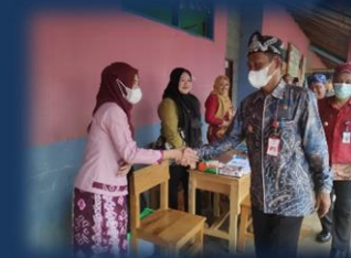
Pelayanan Keliling Perizinan Berusaha