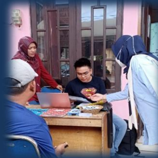
Bimbingan Teknis OSS di Desa